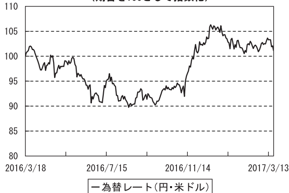
為替市況の推移 （期首を100として指数化）