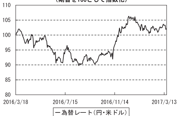
為替市況の推移 （期首を100として指数化）