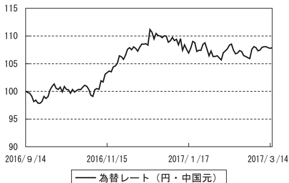
為替市況の推移 (当作成期首を100として指数化)