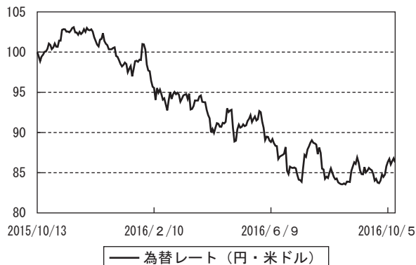
為替市況の推移 (期首を100として指数化)

(注) グラフの数値は、ファンドの基準価額との関連を考慮して、前営業日の値を使用しています。