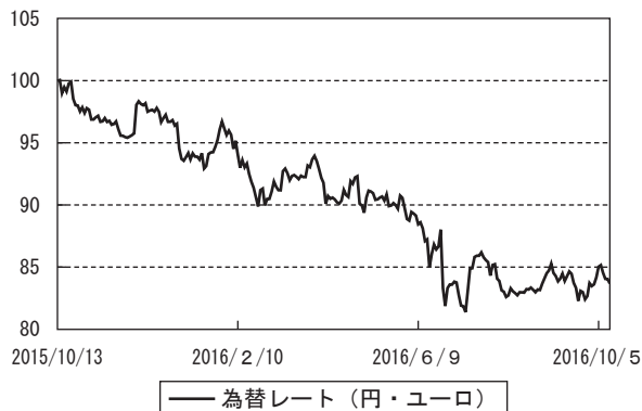
為替市況の推移 (期首を100として指数化)