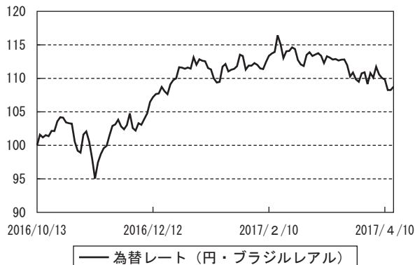
為替市況の推移 (当作成期首を100として指数化)