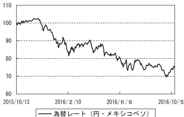
為替市況の推移 (期首を100として指数化)

(注) グラフの数値は、ファンドの基準価額との関連を考慮して、前営業日の値を使用しています。