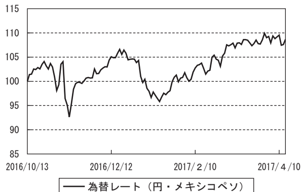
為替市況の推移 (当作成期首を100として指数化)