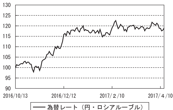
為替市況の推移 (当作成期首を100として指数化)