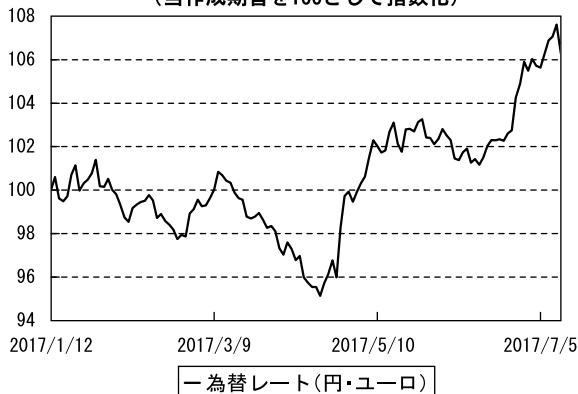
為替市況の推移 (当作成期首を100として指数化)