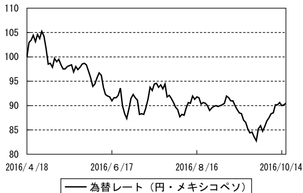
為替市況の推移 (当作成期首を100として指数化)

(注) MSCI 世界高配当公益株指数は、世界の公益株の中から、相対的に配当利回りの高い銘柄で構成される指数であり、MSCI Inc. が開発した指数です。同指数に対する著作権及びその他知的財産権はすべてMSCI Inc. に帰属します。