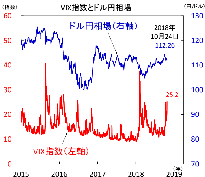
【図2】 VIX指数が上昇、リスク回避の動き強まる

注) 直近値は2018年10月24日。VIX指数（ボラティリティ・インデックス）はS&P500対象のオプション取引を元に算出され、投資家心理を示す数値として利用、先行き不安が生じれば上昇する傾向。