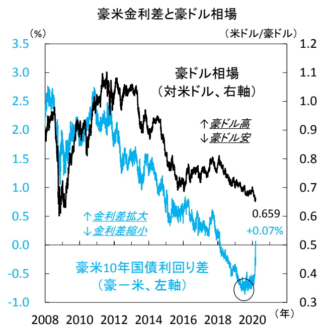
【図3】 金利差から判断すれば豪ドルは底固めの可能性も