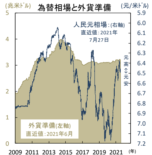
【図1】 株安とともに人民元相場も下落

2009 2011 2013 2015 2017 2019 2021 (年) 出所) 中国人民銀行、Bloombergより当社経済調査室作成