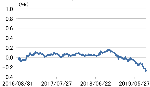
<10年国債利回りの推移>