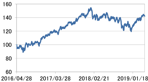
アジア・オセアニア株式指数(円換算)

・アジア・オセアニア株式指数(円換算)は、MSCI オールカントリー・アジア・パシフィック インデックス(除く日本)(税引き後配当込み、米ドル建て)(出所:Bloomberg)を三菱UFJ国際投信が円換算したうえ、グラフの起点を100として指数化したものです。