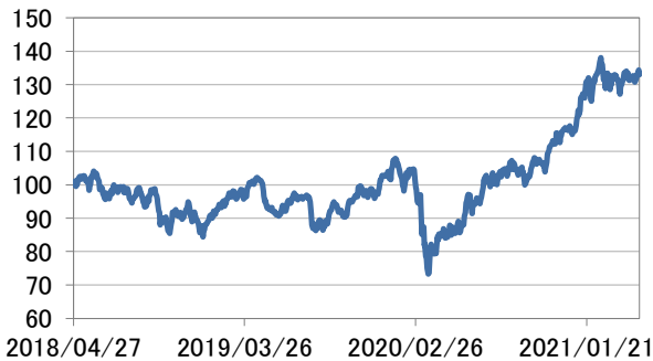
アジア・オセアニア株式指数(円換算)

・アジア・オセアニア株式指数(円換算)は、MSCI オールカントリー・アジア・パシフィック インデックス(除く日本)(税引き後配当込み、米ドル建て)(出所:Bloomberg)を三菱UFJ国際投信が円換算したうえ、グラフの起点を100として指数化したものです。