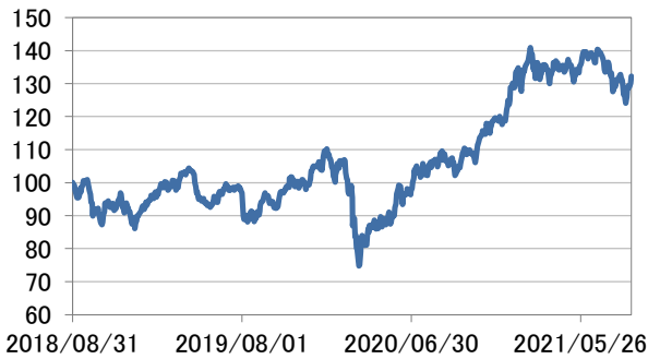
アジア・オセアニア株式指数(円換算)

・アジア・オセアニア株式指数(円換算)は、MSCI オールカントリー・アジア・パシフィック インデックス(除く日本)(税引き後配当込み、米ドル建て)(出所:Bloomberg)を三菱UFJ国際投信が円換算したうえ、グラフの起点を100として指数化したものです。