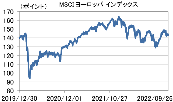
・MSCI ヨーロッパ インデックスはユーロ建ての指数です。