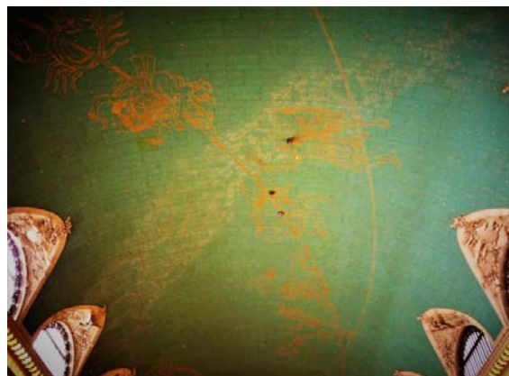
写真：コンコース天井に描かれている星座