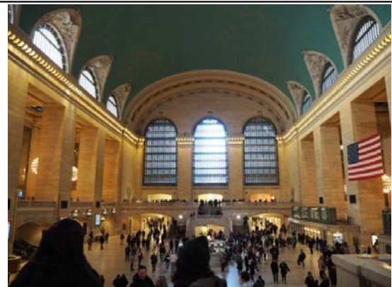
写真：グランドセントラル駅のコンコース

先日、米国に出張に行った際に、ニューヨークで最大規模のグランドセントラル駅を利用しました。映画やドラマでもしばしば登場する有名な駅であり、訪れた際にも、多くの人であふれかえっていました。この駅には44のプラットフォームがあり、単一の駅としては世界最大とのこと。私も、目的の路線を見つけるのに大変苦労しました。右の写真にある、メイン・コンコースが最大の特徴で、東西に約84メートル(275 ft)、南北に約37メートル(120 ft)、そして高さは約38メートル(125 ft)の広い空間になっています。中央にある4面の時計はグランドセントラル駅のシンボリック存在のようで、駅のホームページに、「この時計の下で待ち合わせをする