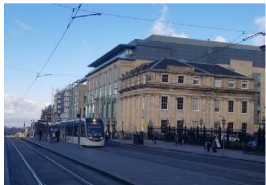
写真: 伝統的な石造りの町並みを走るエジンバラ・トラム。

このような歴史をもつ英国は、鉄道による旅客や貨物の輸送が発達しており、当然ながらスコットランドの首都エジンバラにも鉄道が走っています。エジンバラ・トラムと呼ばれるこの鉄道は、エジンバラ市内の中心部とエジンバラ空港をつなぐ路面電車です。元々空港から市内への移動手段はバスだけでしたが、これを拡充したものです。