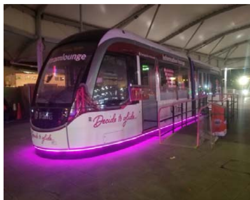
写真: 空港には車体を活用したインフォメーションラウンジがあり、夜はなぜかピンク色にライトアップされています。

このトラムは、1990年代に導入の検討がはじまり、2008年に建設が着工したものの、工期の延期やコスト高騰等の向かい風もあり、かなりの年月をかけることとなり、2014年ようやく開通しました。トラムの設備は、スペインの車両メーカーであるCAF(車体)や、ドイツのコングロマリット(複合企業)であるシーメンス(信号システム)によって供給されており、当然ながらヨーロッパの色が濃い鉄道となっています。トラム自体は完成が新しいこともあり、見た目はかなり近代的である一方、エジンバラは市街そのものがユネスコの世界遺産に登録されているほど、古い町並みが残ります。街中をトラムが走る光景は、伝統と革新の融合とも言うべき不思議な光景で、さすがは英国きっての観光都市であるエジンバラ、町そのものに見る価値があります。