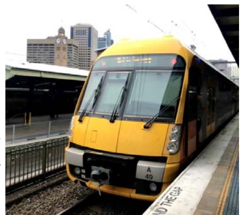
写真：セントラル駅に停車中のシティレール。

シティレールの起源はかなり古いうで、1855年に当時のニューサウスウェールズ植民地にて、最初の鉄道がシドニーとグランビルという都市をつなぐ形で開業したのが始まりでした。1800年代当時より、旅客列車と貨物列車が運行されており、当初の路線から放射状に鉄道網が広がり拡大していったようです。当初は蒸気機関車による運行から始まりましたが、徐々に電化が進み、電化網が整備されました。しかし、貨物事業者がディーゼル牽引を好むことなどから、一部の区間では今もディーゼル運行が残っているなど、オーストラリア