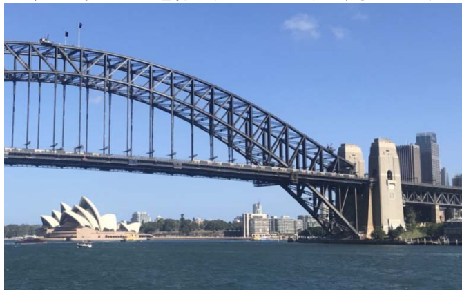
写真：ハーバーブリッジの中央で交差するシドニー鉄道。