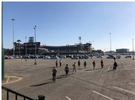
写真：Anaheim駅からスタジアムを望む。

の最寄り駅まで地下鉄で2駅の移動が必要という点でした。往路はまだ明るいので良いのですが、帰りはユニオン駅到着がおそらく23時過ぎとなるであろうと考えられることから、夜のロサンゼルス地下鉄に乗り、更にそこから5分ほどホテルまで歩くという、微かな緊張感を覚悟しなければなりません。