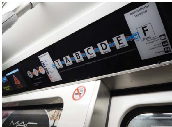
写真：車内の停車駅情報。

この電車は、「The Plane Train」と呼ばれる電車で、アトランタ空港の国際線ターミナルと国内線ターミナルをつなぎ、その途中にある飛行ゲートの付近に停車するつくりとなっています。走行距離は約4.5キロメートルで、8つの駅をかかえる立派な電車です。大荷物を抱える空港利用者のために乗降口は広く、乗り場と電車との間に空間ができないような設計となっており、非常に気が利いている電車です。動く歩道を設置するのではなく、電車を通してしまふ点にアメリカらしさを感じつつ、快適に移動することができました。