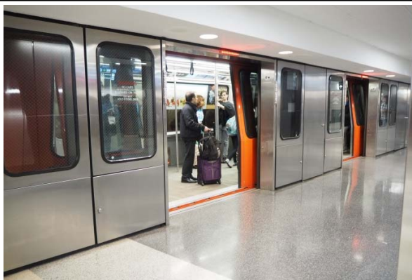
写真：アトランタ空港内で停車中のThe Plane Train。

先日、米国出張に行った際に、ニューヨーク、アトランタ、バーミングハムといった都市を巡りました。それぞれ飛行機を利用して移動をしましたが、中でもアトランタ空港が印象的でした。アトランタ空港は、最新の2017年の世界の年間乗客数ランキングでも首位となり、20年間連続の首位をキープしている空港で、実際に降り立ってみると大変広く感じられました。そのため、アトランタ空港に到着して、まず外に出ようと出口までの道のりを確認した際に、その遠さに驚いたことを覚えています。長距離の歩行を覚悟して空港内を歩き進みましたが、途中でさしかかった長い歩道の両脇に電車が通っていることに気づきました。