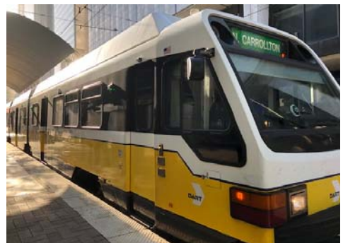
写真：ダラスのダウンタウンと近郊の都市をつなぐDART (Dallas Area Rapid Transit)。市内の主要な場所にはこれで移動できます。

ストックヤードといわれる西部劇に出てくるような地区があり、観光スポットとなっています。ここでテキサスロングホーンと呼ばれる長い角を持った牛のパレードなどを見学しました。いかにも『アメリカ!』という休暇でした。