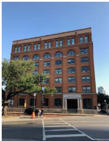
写真：教科書倉庫ビルの外観。

ダラスといえば、1963年にケネディ大統領がオープンカーに乗ってパレード中に暗殺された地。今だに真相については諸説飛び交っていますが、その暗殺犯が狙撃をしたのが「テキサス教科書倉庫ビル」でした。この目の前