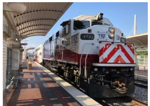
写真：ダラスとフォートワースを結ぶTrinity Railway Express。