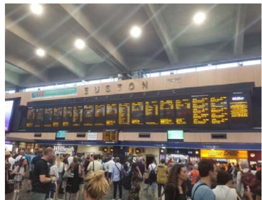
写真：ユーストン駅のコンコース

ユーストン駅はカムデン・ロンドン特別区にあり、写真の通りたくさんの電車が行き来するロンドンの主要駅の一つであり、1830年代開業の、英国でも最も古い鉄道駅の一つです。現在の駅舎はその後建て替えられたこともあり、比較的新しい印象をうけ、1800年代のレトロな雰囲気、という印象はありませんでした。なお、英国縦断をする場合、いくつか出発点となる駅はありますが、実は「ロンドン駅」という名称の駅は英国には存在しません。