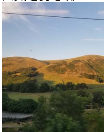
写真：車窓からの一枚

途中何度か乗り換えてエジンバラを目指しましたが、WiFiが整備されている電車もあり、比較的快適に過ごすことができました。窓から見える風景は写真の通りのどかなもので、英国らしく都市部を離れると、農業や牧畜が行われているところも多く見られました。