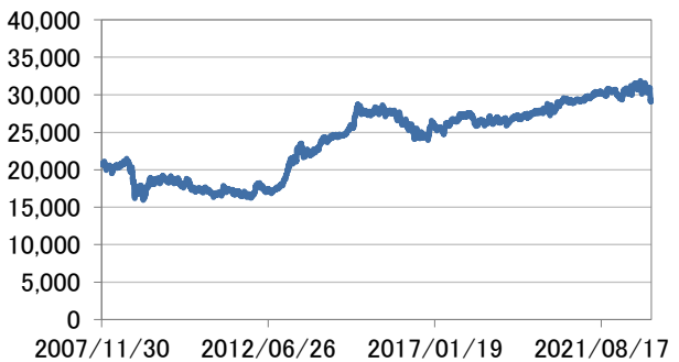
— FTSE世界国債インデックス(除く日本、円換算ベース)