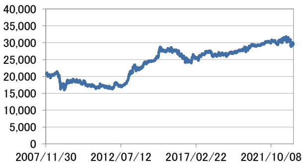
— FTSE世界国債インデックス(除く日本、円換算ベース)