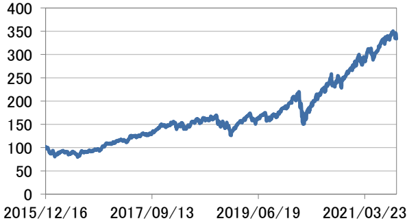
世界情報技術株式指数(円換算)

・世界情報技術株式指数(円換算)は、基準日前営業日のMSCI オールカントリー・ワールド インデックス / 情報技術(税引き後配当込み米ドル建)を基準日のわが国の対顧客電 信売買相場の仲値により委託会社が円換算したうえ2015年12月16日を100として指数化 したものです。