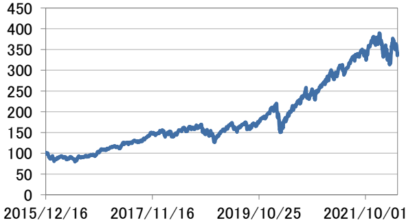
世界情報技術株式指数(円換算)

・世界情報技術株式指数(円換算)は、基準日前営業日のMSCI オールカントリー・ワールド インデックス / 情報技術(税引き後配当込み米ドル建)を基準日のわが国の対顧客電信売買相場の仲値により委託会社が円換算したうえ2015年12月16日を100として指数化したものです。