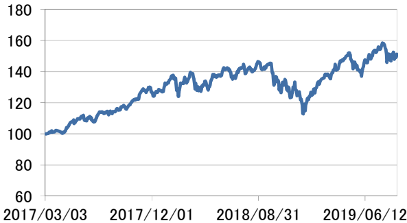
世界情報技術株式指数(現地通貨建て)

・世界情報技術株式指数(現地通貨建て)は、基準日前営業日のMSCI オールカンントリー・ワールド インデックス/情報技術(税引き後配当込み、現地通貨建て)を基に2017年3月3日を100として指数化したものです。