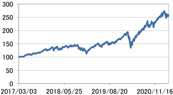
世界情報技術株式指数(現地通貨建て)

・世界情報技術株式指数(現地通貨建て)は、基準日前営業日のMSCI オールカンントリー・ワールド インデックス/情報技術(税引き後配当込み、現地通貨建て)を基に2017年3月3日を100として指数化したものです。