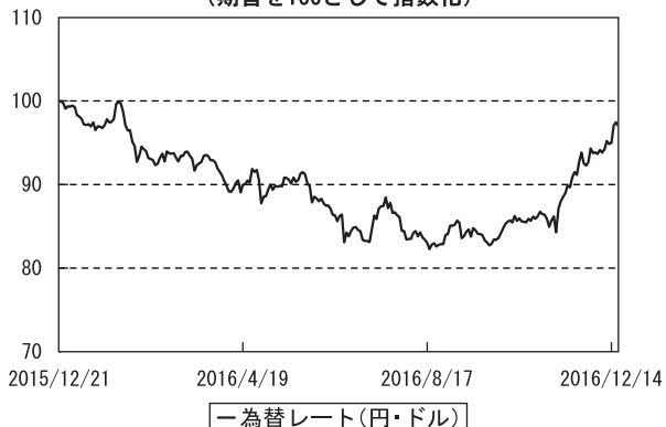
為替市況の推移 （期首を100として指数化）