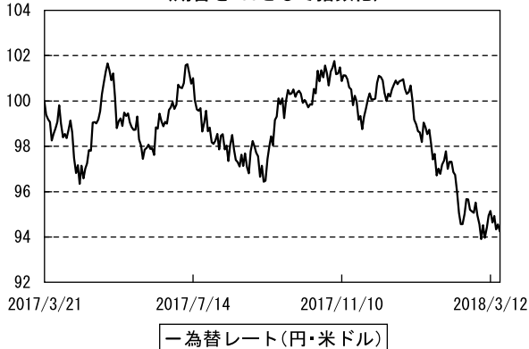
為替市況の推移 （期首を100として指数化）