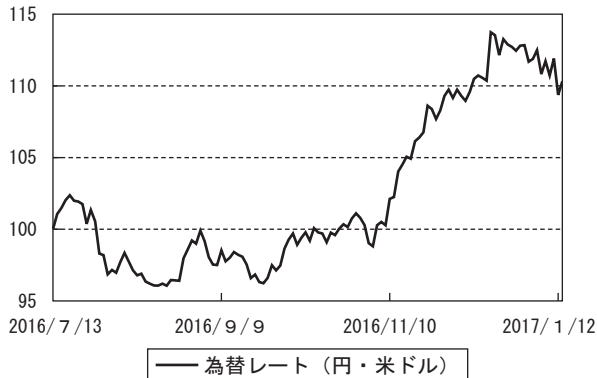
為替市況の推移 (当作成期首を100として指数化)