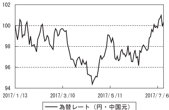
為替市況の推移 （当作成期首を100として指数化）