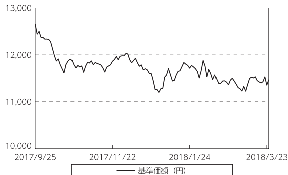
基準価額等の推移