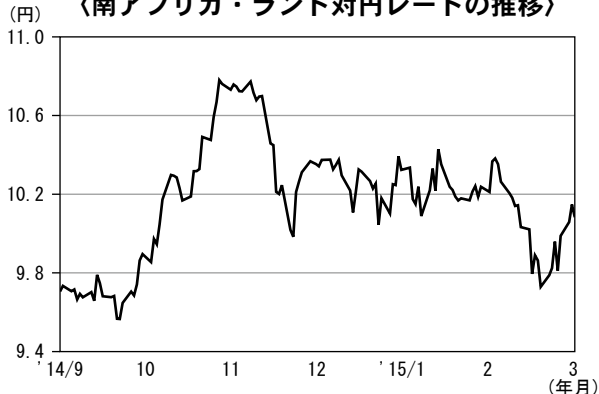
〈南アフリカ・ランド対円レートの推移〉