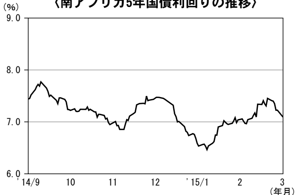
〈南アフリカ5年国債利回りの推移〉