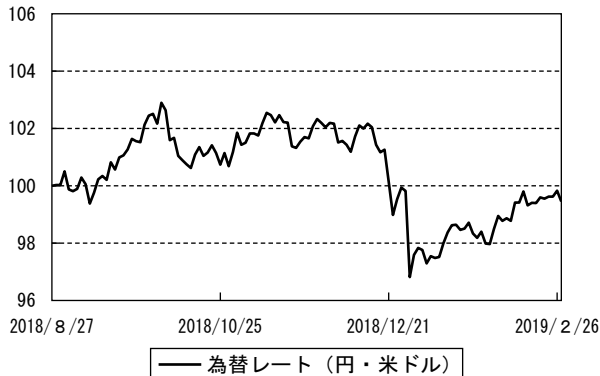
為替市況の推移 (期首を100として指数化)