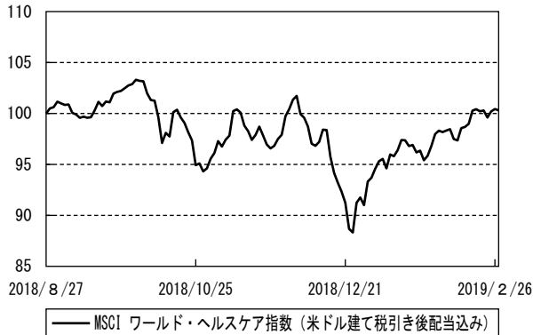
参考指数の推移 (期首を100として指数化)