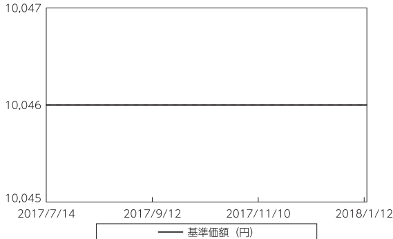
基準価額等の推移