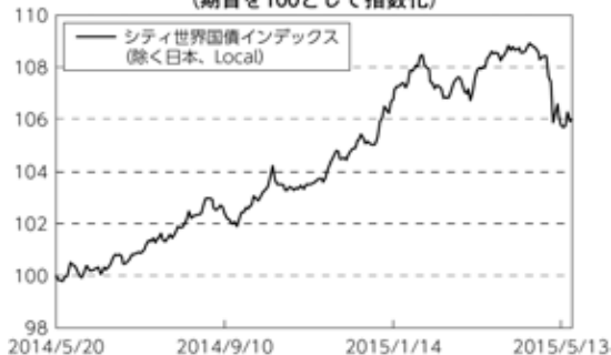
債券市況の推移 (期首を100として指数化)