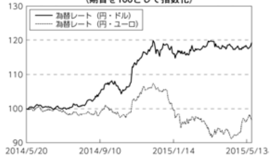
為替市況の推移 (期首を100として指数化)

・世界経済の先行き不透明感の高まりや先進国のインフレ期待の低下などに加え、ECB（欧州中央銀行）による追加緩和策の発表および実施などを背景に、金利は総じて低下（債券価格は上昇）しました。