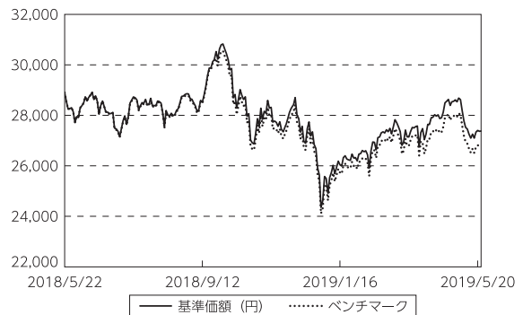
基準価額等の推移

(注) ベンチマークは期首の値をファンド基準価額と同一になるよう指数化しています。