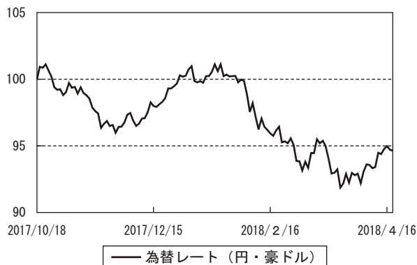
為替市況の推移 (当作成期首を100として指数化)

(注) MSCI 世界高配当公益株指数は、世界の公益株の中から、相対的に配当利回りの高い銘柄で構成される指数であり、MSCI Inc. が開発した指数です。同指数に対する著作権及びその他知的財産権はすべてMSCI Inc. に帰属します。