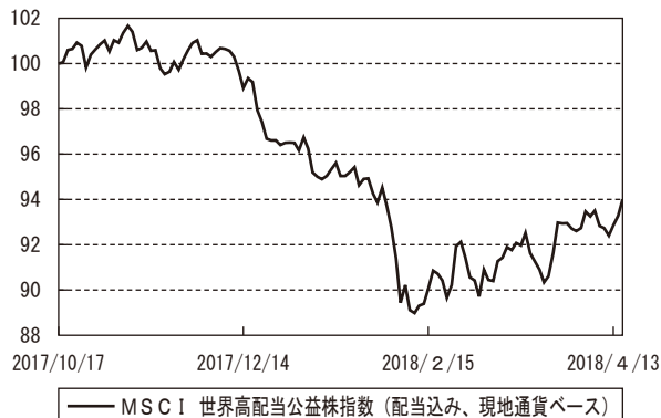
(ご参考) 株式市況の推移 (当作成期首を100として指数化)