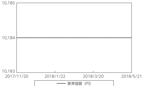
基準価額等の推移