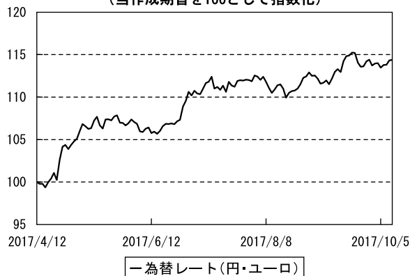
為替市況の推移 （当作成期首を100として指数化）