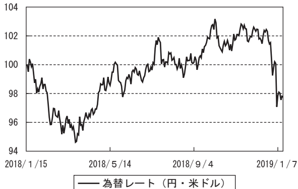
(ご参考) 為替市況の推移 (期首を100として指数化)

・期首から2018年6月下旬にかけては、相対的に高い配当利回りなど各種バリュエーションの割安感や、東京都心をはじめとしたオフィス・ビルの空室率低下と賃料上昇の傾向が強まったことなどをを受けて、上昇基調で推移しました。7月以降は、米中間を中心とした貿易摩擦問題や、REIT各社による公募増資が相次いで発表されたことによる投資口需給への懸念などから一時的に弱含む局面もありましたが、日銀の金融緩和策による低金利環境の継続と、安定した改善基調を辿る不動産市況などを背景に11月は反発に転じました。期末にかけては、米国を起点とする世界的な株式市況の下落などをを受けて調整する局面もありましたが、期を通じてみると上昇しました。