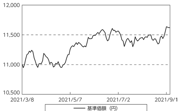
基準価額等の推移