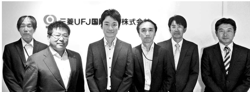
株式運用部 ファンドマネージャー

当ファンドでは、ビューティー市場の構造的な成長からの恩恵を享受すると考えられる企業を中心に投資を行います。また、ビューティー市場の動向を常に精査しながら、ポートフォリオの調整や新規銘柄の発掘などを行い、今後もパフォーマンスの向上に努めてまいります。