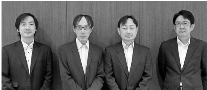
株式運用部 ファンドマネージャー

ビューティー市場は、高齢化によるアンチエイジング需要の高まりや、女性の社会進出など社会構造の変化、新興国での化粧文化の普及といった構造的な成長要因により、中長期にわたり着実な成長が見込まれる、という見方に変更はありません。このような構造的な成長要因を背景に、2021年以降は、経済の正常化に伴う外出機会の増加や旅行需要の回復に加えて、中国での「ライブコマース」といった新しい販売手法の普及などが原動力となって1桁台後半での成長が継続していくと予想しています。当ファンドでは、ビューティー市場の構造的な成長からの恩恵を享受すると考えられる企業を中心に投資を行います。また、ビューティー市場の動向を常に精査しながら、ポートフォリオの調整や新規銘柄の発掘などを行い、今後もパフォーマンスの向上に努めてまいります。