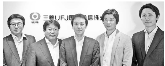
株式運用部 ファンドマネージャー

とりわけ、世界最大の自動車市場である中国の自動車政策に注目しています。中国政府は2019年から自動車メーカーが中国で生産および輸入する台数の一定割合を新エネルギー車にするよう義務付けています。世界最大の自動車市場である中国の決定はEV時代の本格的な幕開けにつながると予想され、車載用リチウムイオン電池市場の拡大などに期待しています。